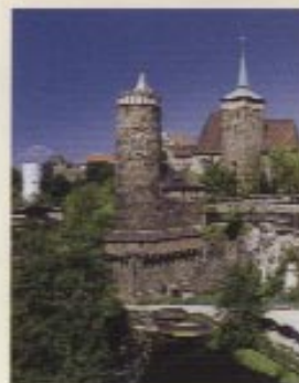
Alte Wassermühle in Bautzen

Diese Tour führt Sie immer an der Spree durch die Stadt Bautzen. Die Friedensbrücke führt an der Alten Wassermühle vorbei. Die restaurierten Häuser mit der Michaeliskirche und dem Nicolaifriedhof sind nur wenige Kilometer vom Saurierpark entfernt.